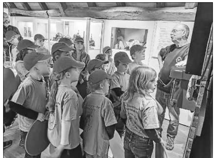
Voller Aufmerksamkeit lauschen die Minis den Erzählungen aus alten Feuerwehrzeiten