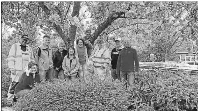
Nach getaner Arbeit