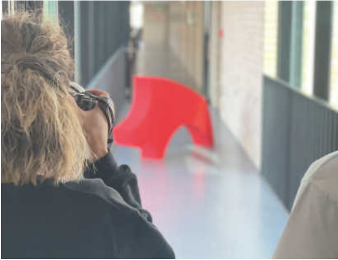
Fotografin Melanie Schneider während der Aufnahmen für die Personalkampagne im Ebersbacher Rathaus.