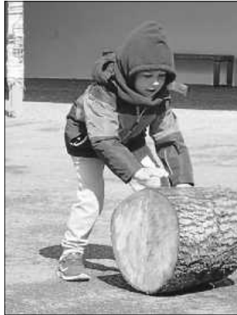
Jetzt nur noch in den Garten reinrollen.

Und jetzt haben wir SIEBEN Wildniszwergen-Sitzplätze in der Pustelblume. Vielen Dank dem lieben „Holzhacker-Buam“. ;o)