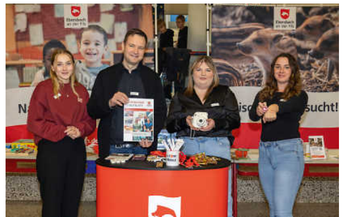
Neue Werbematerialien verschaffen gute Aufmerksamkeit, wie hier beim Markt der Möglichkeiten im Raichberg-Schulzentrum.

Im vergangenen Sommer startete der erste Teil der vom Gemeinderat gebilligten neuen Personalkampagne, um mit pfiffigen Motiven die Aufmerksamkeit von potentiellen Auszubildenden anzusprechen. Neben klassischen Anzeigen kommen hier auch Aufsteller bei Ausbildungsmessen zum Einsatz.