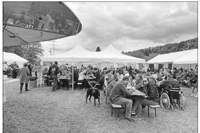
... und so, wenn sich dann die Gäste bei uns wohlfühlen

Auch für die kleinen Gäste haben wir einiges im Angebot: Ab der Mittagszeit gibt es wieder ein abwechslungsreiches und attraktives Kinderprogramm, inklusive dem beliebten Kinderschminken und den legendären Pferdekutschen-Fahrten. Also Familiensontag pur bei uns auf der Festwiese!