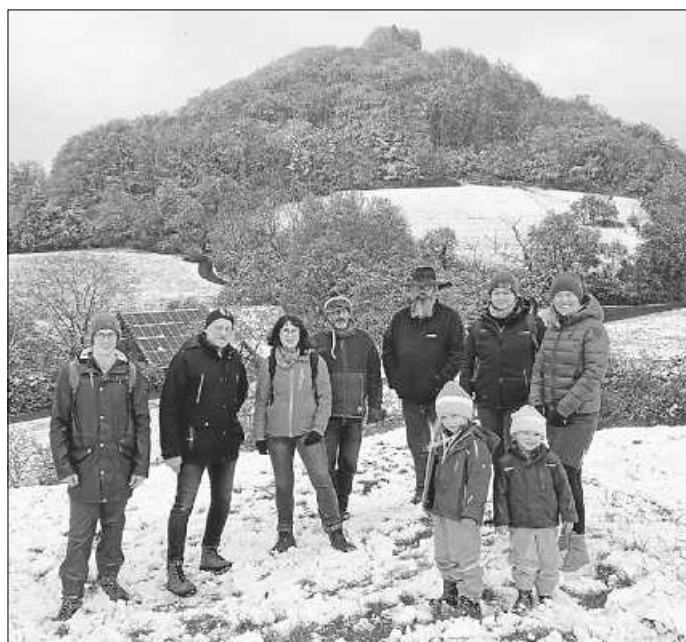
Gut gelaunte Truppe des RMSV vor dem Hohenstaufen

Am Sonntag, dem 21. April, traf sich eine Gruppe des RMSV um 11:00 Uhr zum Rundgang zur geführten Wanderung mit Förster Kai rund um den Hohenstaufen.