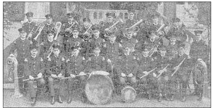
Wussten Sie das? Von 1924 bis 1937 gab es eine Feuerwehrkapelle in Ebersbach, hier eine Aufnahme aus dem Jahr 1927

Mit vielen Ausstellungsstücken, fünf Filmen und ungezählten Fotografien bietet die Sonderausstellung im Museum besonders viel Abwechslung. Alles rund um die Geschichte unserer Feuerwehr, ihre Ausrüstung und ihre Herausforderungen wird darin gezeigt. Filme machen das noch lebendiger. Auch für Familien und Kinder zum Entdecken geeignet.