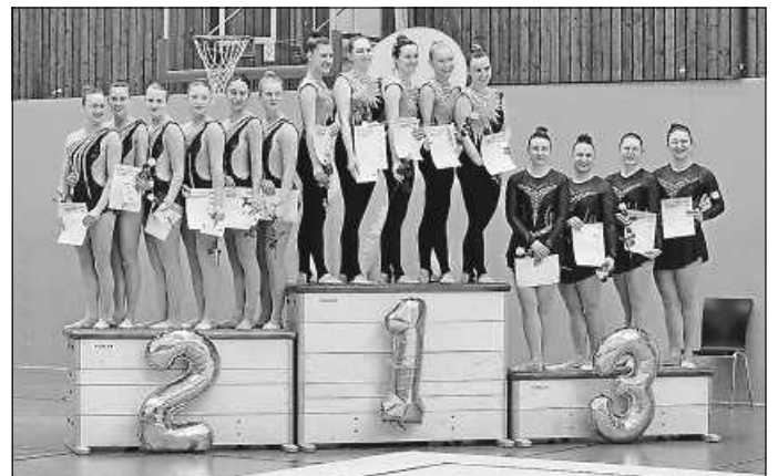
3. Platz für die Daisys

Die Daisys durften sich am Ende mit einem minimalen Rückstand über einen starken dritten Platz und den klaren, verdienten Verbleib in der Landesliga freuen.