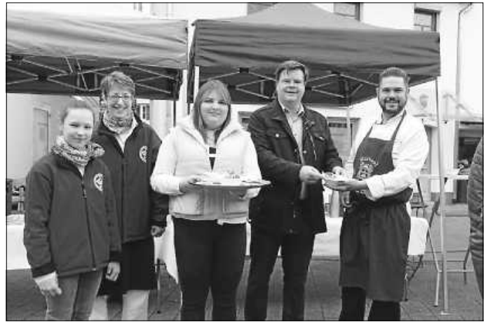
Neben dem „Zum Bäckerhaus“ ist dieses Mal die „Metzgerei Rapp“ ab 9 Uhr dabei.

Der Ebersbacher Wochenmarkt Spargel-Spezial findet am kommenden Samstag statt. Ziel der Spezialmärkte ist es, gastronomische Angebote und den Ebersbacher Einzelhandel mit den Angeboten der regionalen Erzeuger zu verbinden. Gleichzeitig soll damit ein Anreiz gegeben werden, mehr Zeit auf dem Marktgelände zu verbringen und ins Gespräch mit Bekannten und Freunden zu kommen. „Ich freue mich sehr, dass die Metzgerei Rapp den Marktkunden gleich noch köstliche Schinkenvariationen fürs Spargelmenü anbietet.“