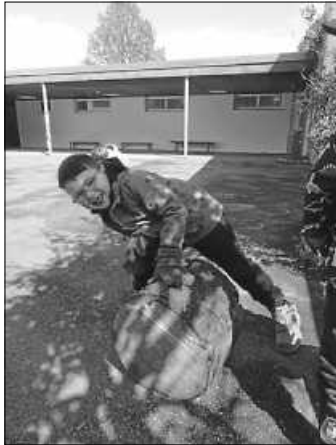
Geschafft, die Holzstämme wurden den Berg runtergerollt.

Ein total lieber Nachbar, mit Enkel im Kindi-Alter, ließ die Axt kurz ruhen, um sich den Wunsch unserer „Mittleren“ Kinder anzuhören. „Ihr wollt Baumstämme haben, zum Draufsitzen? Na klar, da hab' ich was für euch!“ Nachdem wir die unter den Baumstämmen wohnenden Regenwürmer „umgesiedelt“ hatten (nach eingehender Untersuchung natürlich) – konnte es losgehen. Der Hang wurde uns zunutze, in dem wir die Baumstämme einfach heruntergerollt haben. Was für ein riesen Spaß das war!