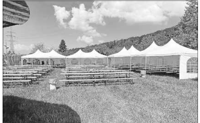
So sieht es aus, wenn wir alles hergerichtet und aufgebaut haben ...

Gespannt sind wir auf den Zuspruch unserer ersten Pflanzentauschbörse: Die Aktion läuft am Sonntag von 11 Uhr bis 14 Uhr. Ab 11 Uhr können die Pflanzen auf dem Blütenfest am ausgeschilderten Zelt abgegeben werden. Gegen 12 Uhr haben wir dann hoffentlich so viele Töpfchen, dass wir den Tausch beginnen können. Aber auch wer danach kommt, kann noch seine „Sprösslinge“ mitbringen und gegen anderes „Grünzeug“ eintauschen. Wer übrigens schon vor 12 Uhr seine Sachen vorbeibringt, erhält einen Chip und kann sich mit ihm auch noch später etwas holen. Was dann um dreiviertel Zwei noch auf den Tresen steht, können auch Festbesucher mitnehmen, die keine Eigenkreationen mitgebracht haben. Die Börsenteilnahme ist von keiner OGV-Mitgliedschaft abhängig. Alle Tauschwilligen sind herzlich willkommen! (Mehr zur Pflanzentauschbörse auch im separaten Bericht dazu).