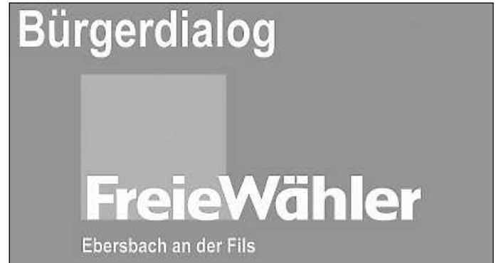
Bürger Dialog LOGO