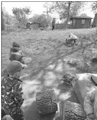
Ufff, ... hochwärts gehts viel schwerer als runterwärts!

Und jetzt haben wir SIEBEN Wildniszwergen-Sitzplätze in der Pustelblume. Vielen Dank dem lieben „Holzhacker-Buam“. ;o)